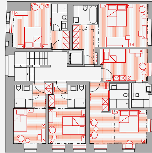
Grundriss 4. Obergeschoss (Normgeschoss), 1:200