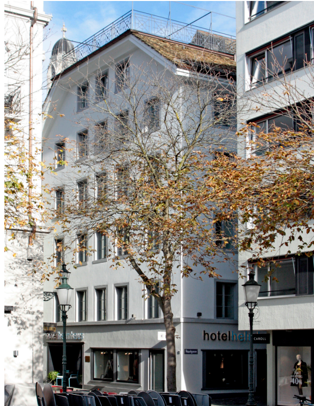
Hotel Helmhaus, Ansicht vom Schifflandeplatz