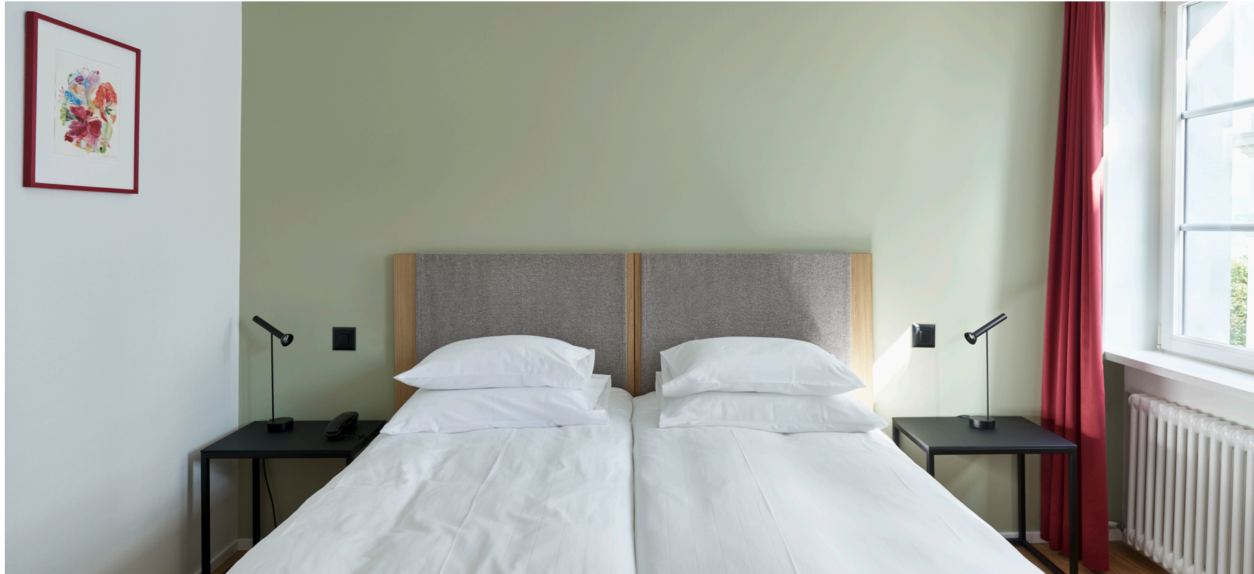
Zimmer „Boutique Relax“