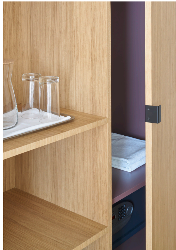
Detail Schrank, Innenleben