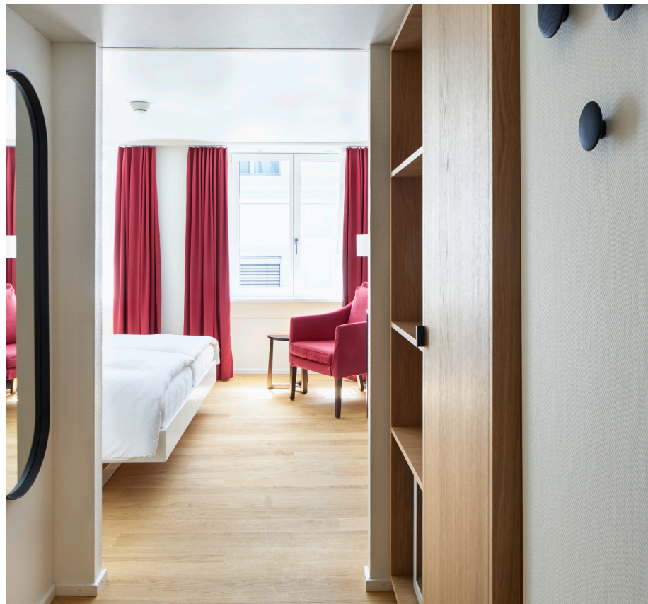
Zimmer „Boutique Relax“, Wohn- und Eingangsbereich