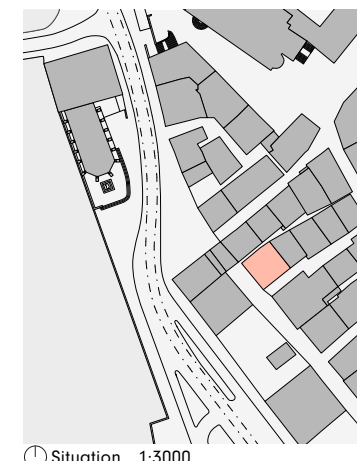
① Situation, 1:3000